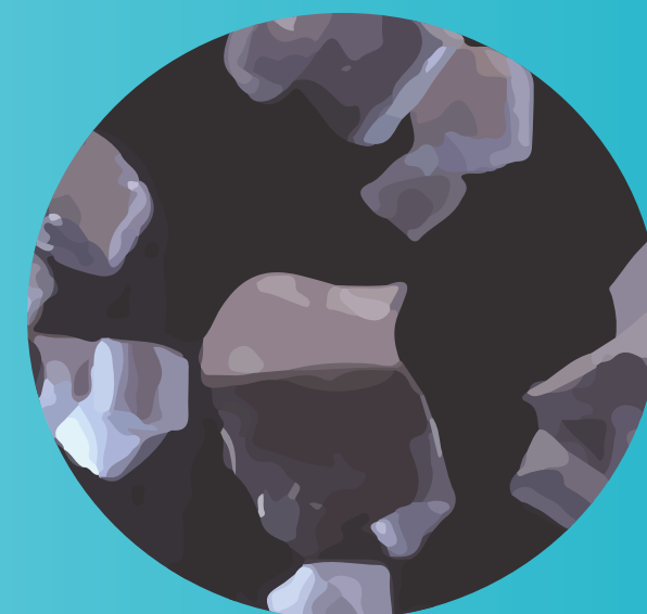
Calcaire sous forme calcite

Le système Amilo permet de transformer le calcaire (calcite) en aragonite, une forme qui lui fait perdre la quasi-totalité de ses propriétés incrustantes.